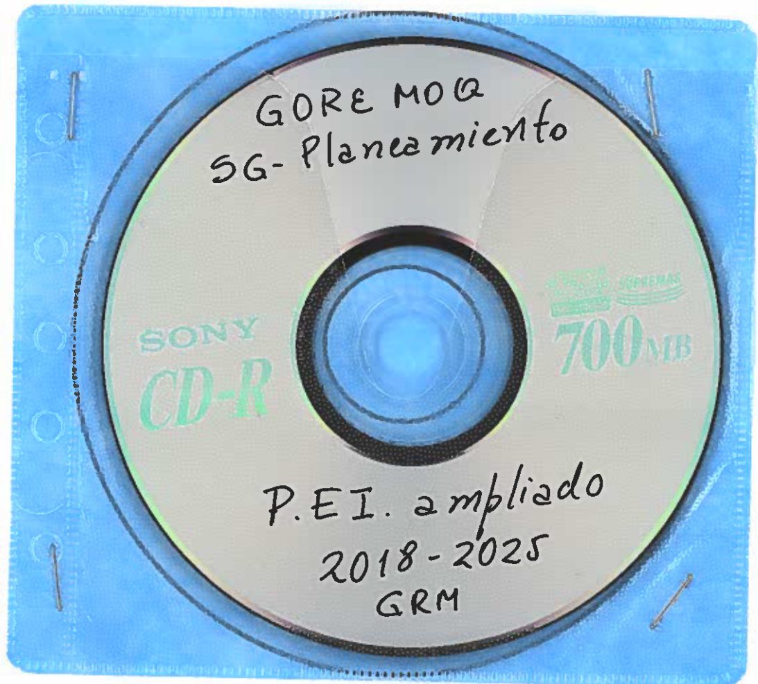
Compact Disk (CD)