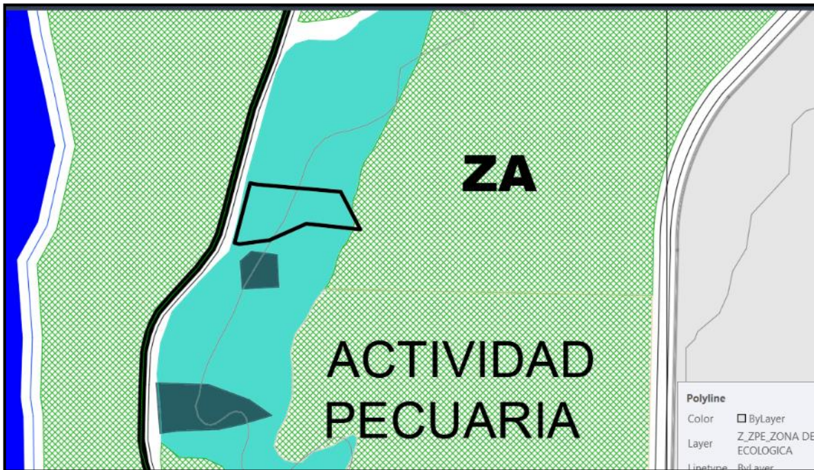
Zona de Reglamentación Especial 04 (ZRE-4).