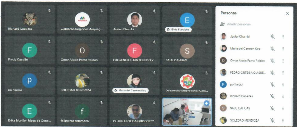
Participantes del Taller Virtual, actores acreditados al proceso del presupuesto participativo regional 2024 del Gobierno Regional Moquegua.