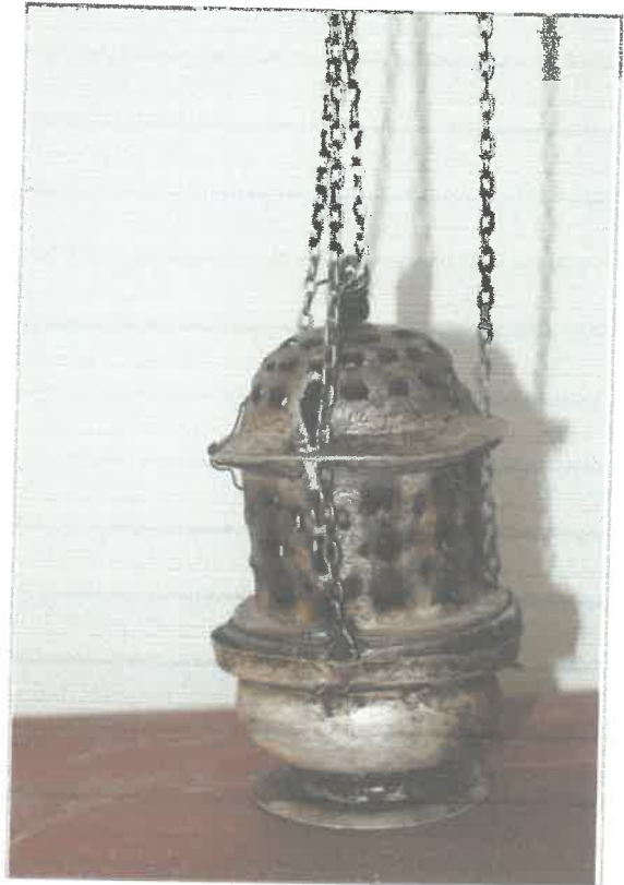
Imágen: Incensario cerrado