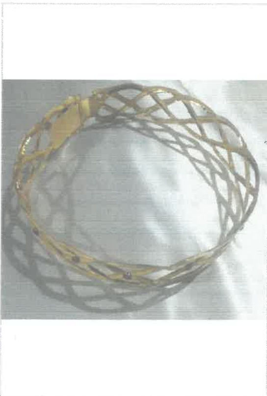
Imágen: Corona de espinas