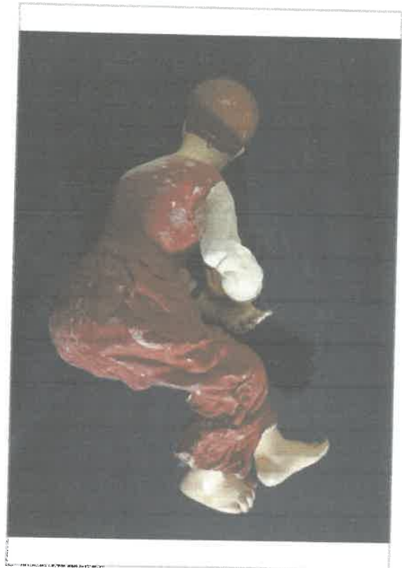
Imágen: Vista Lateral Derecha