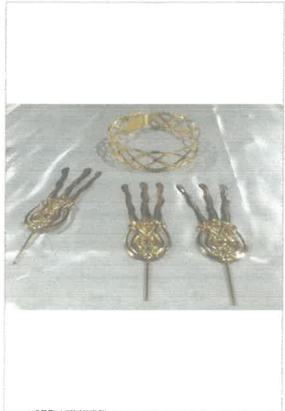
Imágen: Corona de espinas y potencias