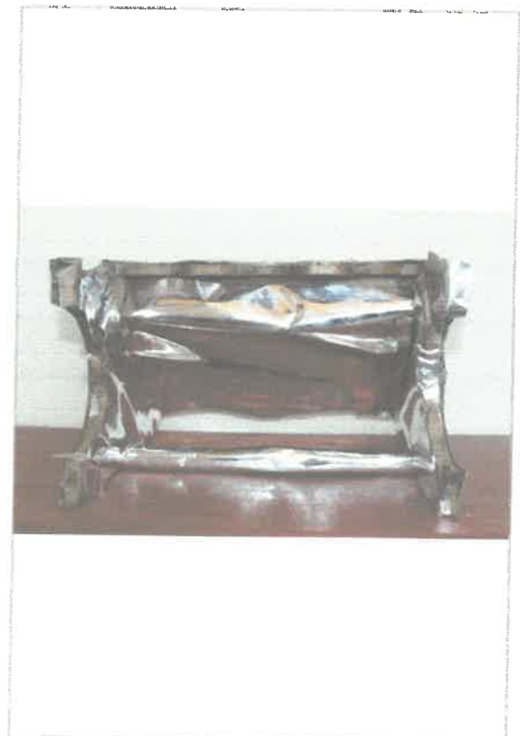
Imágen: Vista Inferior