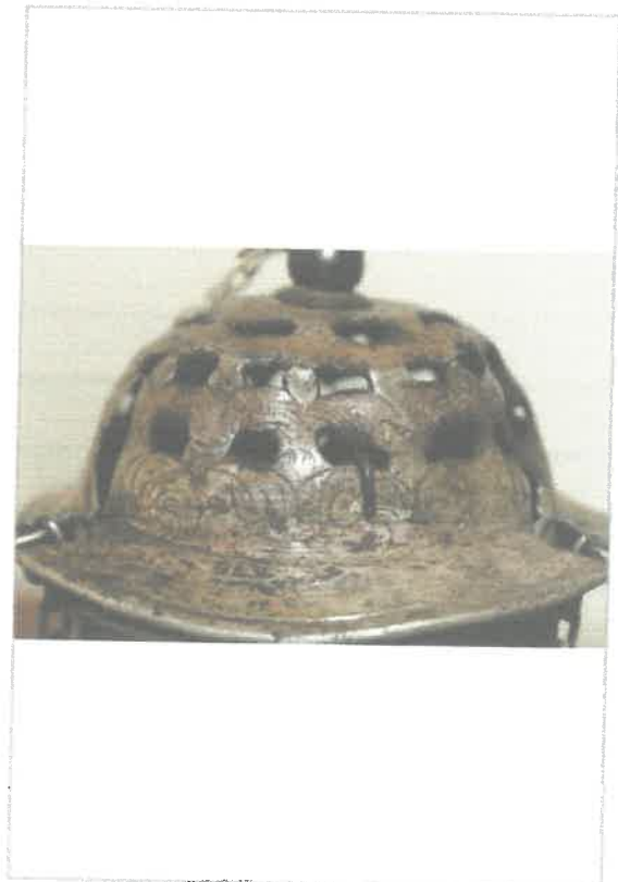
Imágen: Vista de tapa