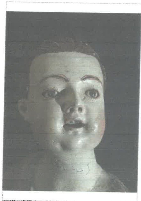
Imágen: Detalle de cabeza