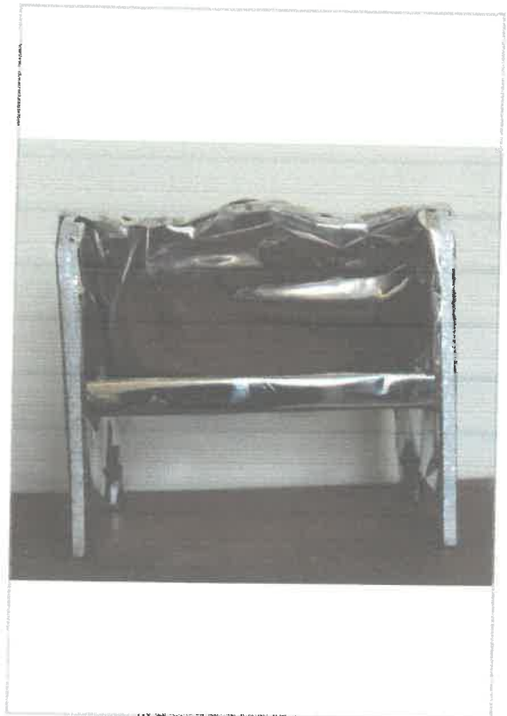
Imágen: Vista Posterior