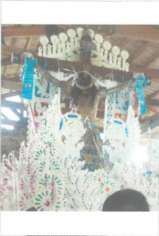
Imágen: Procedencia de piezas