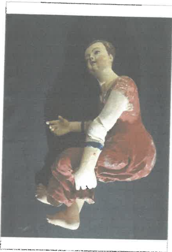
Imágen: Vista Lateral Izquierda