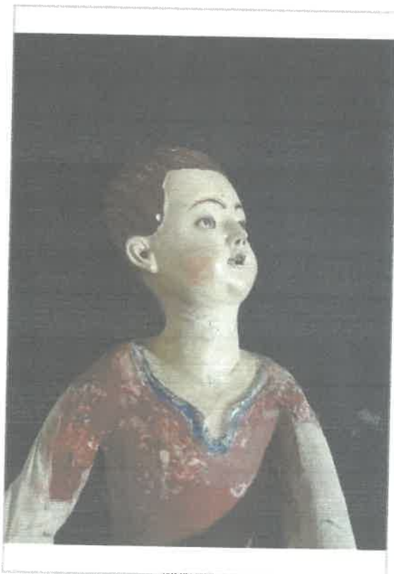
Imágen: Vista Superior