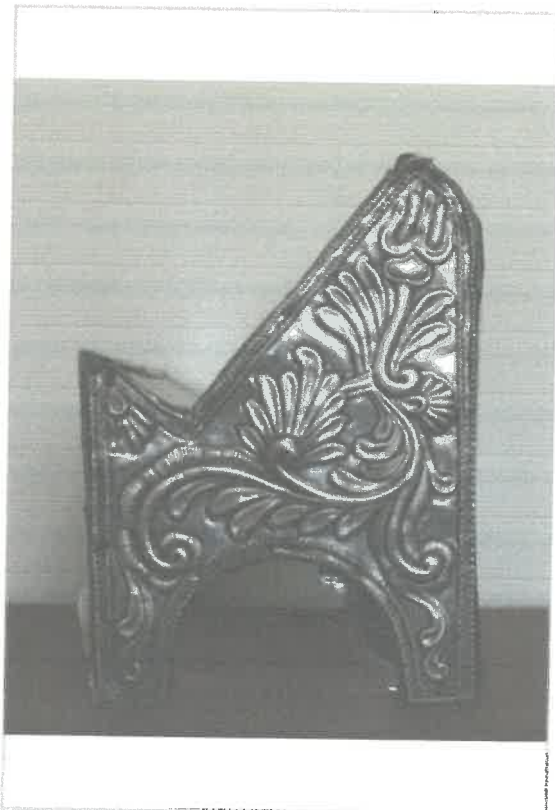
Imágen: Vista Lateral Izquierda