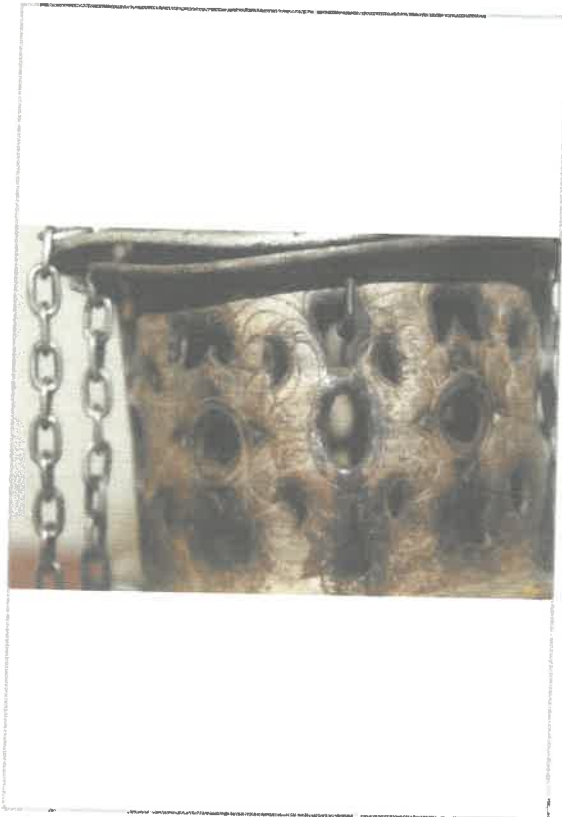
Imágen: Vista de cuerpo