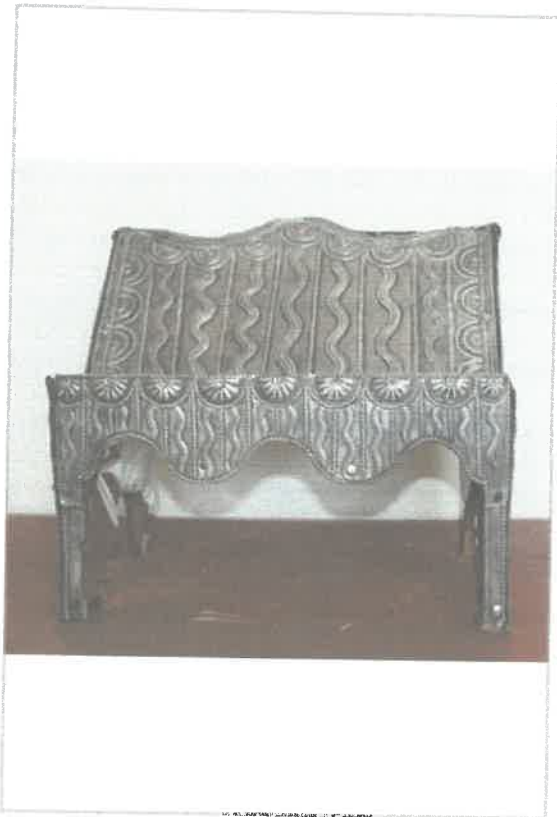
Imágen: Vista Anterior