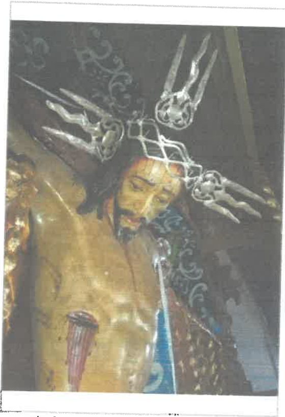
Imágen: Procedencia de las piezas