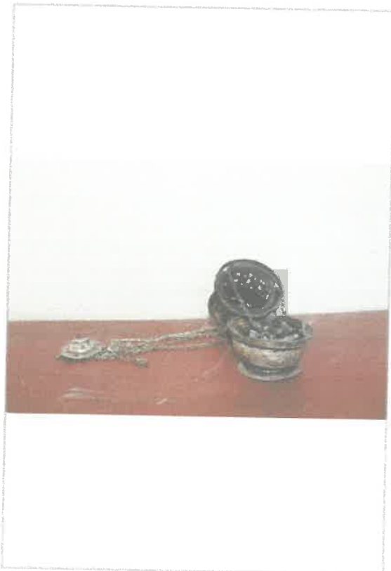
Imágen: Incensario abierto